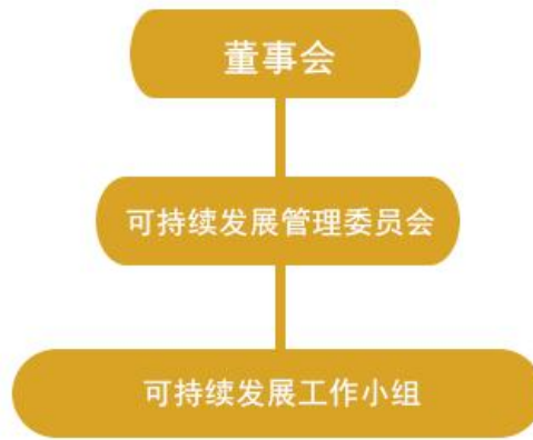
图：铜博科技可持续发展管理架构

铜博科技建立了自上而下的可持续发展管理架构，致力于将可持续发展理念和对利益相关方的承诺落实为具体行动。铜博科技可持续发展管理架构及各层级的职责如下：